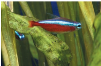
Rozmiar zbiornika uzależniony jest od potrzeb ogrzewania

Unikaj akwarium w kształcie pionowej ustawionej wieży. Jeśli przyjrzesz się jego poziomej płaszczyźnie, stwierdzisz, że ryby mają w nim ograniczoną przestrzeń do pływania. Ma też ono stosunkowo niewielką powierzchnię w porównaniu ze swoją objętością. Prowadzi to do mniej efektywnej wymiany gazowej, która zachodzi na powierzchni wody. Wymiana gazowa polega na oddawaniu z wody do powietrza dwutlenku węgla i zastępowaniu go tlenem.